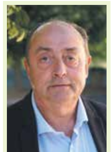
Vice-président au Siredom, maire de Saint-Chéron